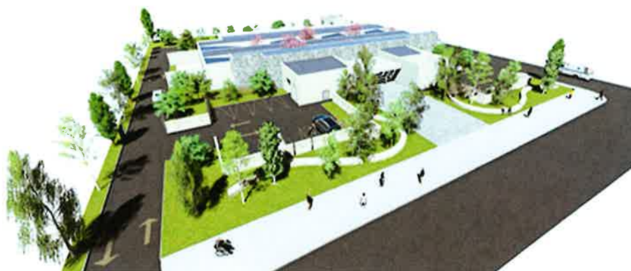
Vista Aérea Desde Acceso Principal

República de Chile I. Municipalidad de Zapallar Secretaría Municipal