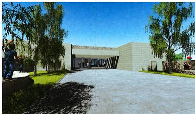
Vista Acceso Principal