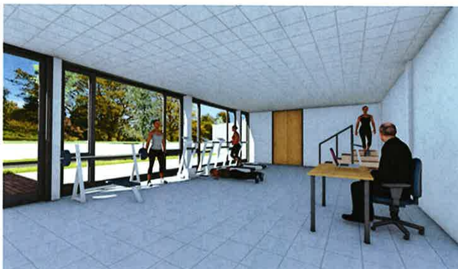
Vista Interior Sala Rehabilitación