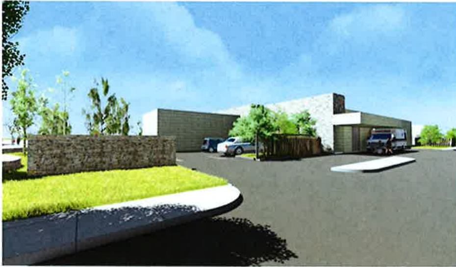
Vista Poniente Acceso Urgencia

República de Chile I. Municipalidad de Zapallar Secretaría Municipal