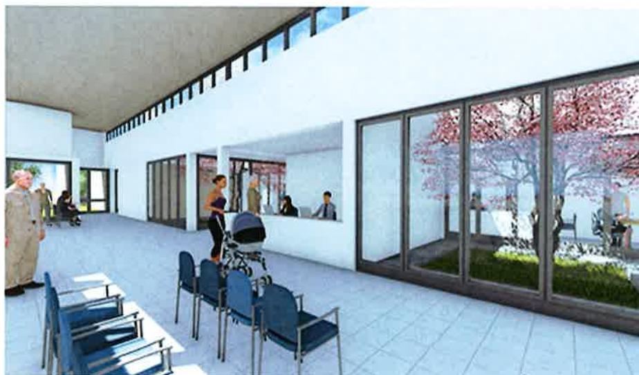
Vista Interior Hall Espera

República de Chile I. Municipalidad de Zapallar Secretaría Municipal