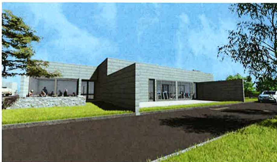
Vista Oriente Calle Interior

República de Chile I. Municipalidad de Zapallar Secretaría Municipal