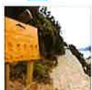
OBRAS - Se habilita un aula, un jardín y se instala una red de sensores sísmicos

CIUDAD. La iniciativa es pionera a nivel del país y busca fortalecer la capacidad de respuesta ante estas emergencias.