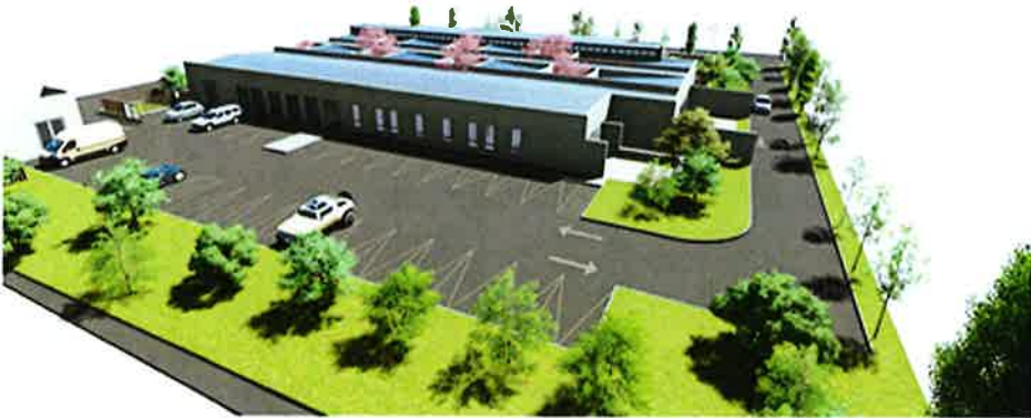
Vista Aérea Sur Zona Estacionamiento