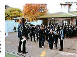
ESTUDIANTES Y PADRES SEÑALAN LA UBICACIÓN DE LOS SENSORES

de la comuna. La inversión total de la iniciativa es de $8 millones. El proyecto incluye la instalación de una red de sensores sísmicos en la escuela y el jardín, lo que permitirá detectar temblores de menor magnitud que los que se registran en las áreas de evacuación de preparación ante un sismo de mediana o gran intensidad. La instalación de estos sensores permitirá contar con un sistema de alerta temprana que permita evacuar a los niños y niñas de la zona de forma segura.