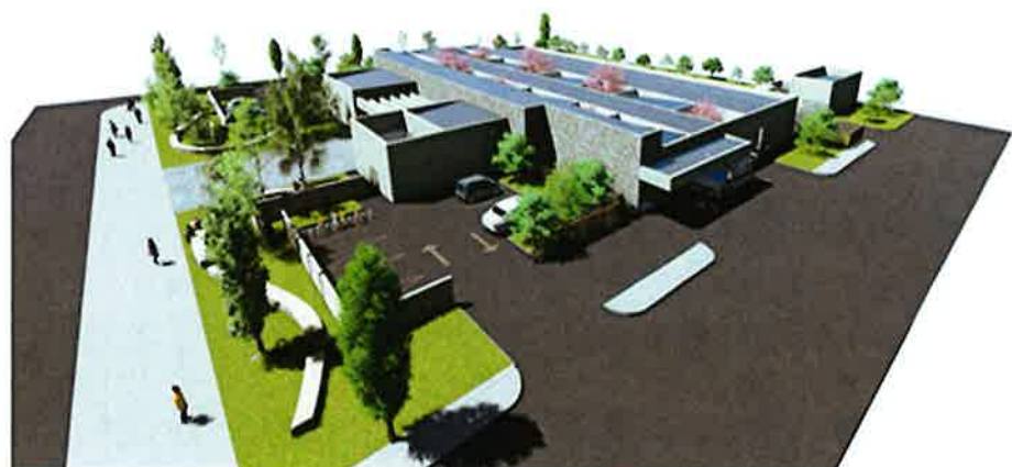
Vista Aérea Desde Norponiente