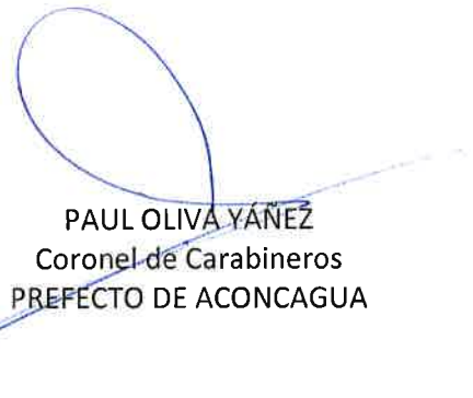
PAUL OLIVA YAÑEZ Coronel de Carabineros PREFECTO DE ACONCAGUA