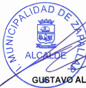
GUSTAVO ALESSANDRI BASCUÑAN Alcalde