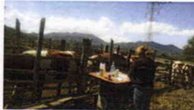
Compra de Insumos veterinarios