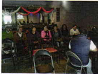
Mesa de Coordinación